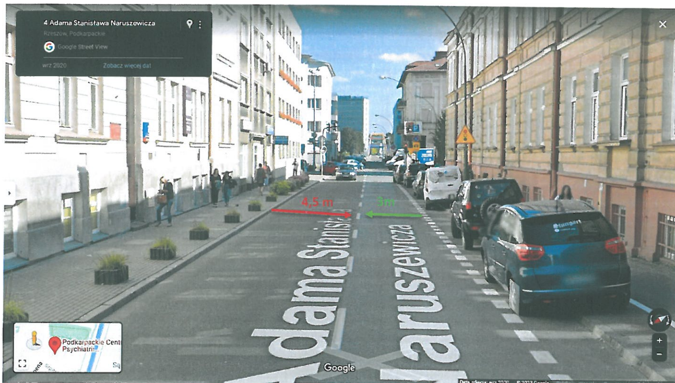
Rysunek 3 Zdjęcie google maps

Obecnie pas ruchu z zaparkowanymi samochodami jest węższy niż z kierunku przeciwnego, gdzie miejsc parkingowych nie ma. Kierowcy po przesunięciu linii separującej pasy ruchu będą mieli więcej bezpiecznego buforu przy wysiadaniu z pojazdów