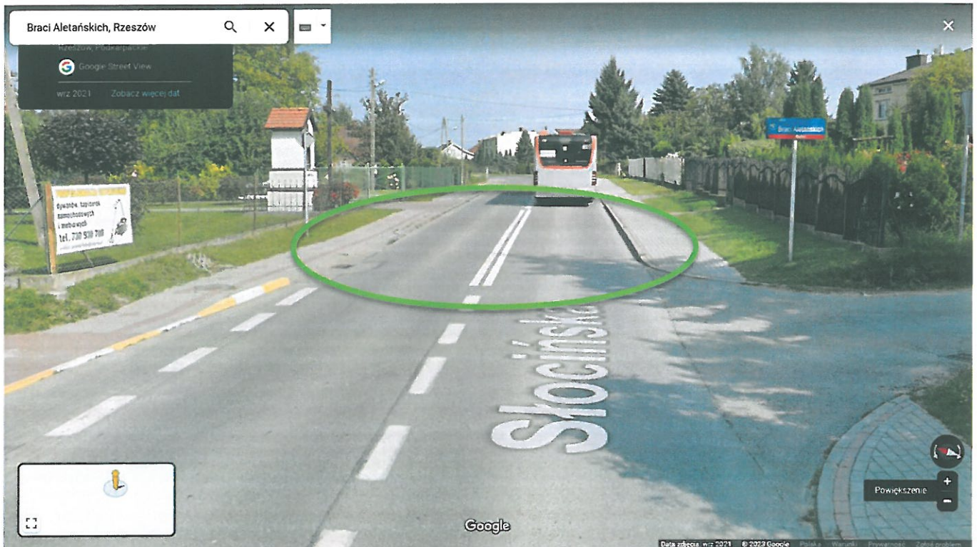
Rysunek 4. Zdjęcie google maps, miejsce proponowanego przejścia dla pieszych

Pragnę również zauważyć że najwięcej zgłoszeń na Krajowej Mapie Zagrożeń, oraz w sprawozdaniu Komendanta Straży Miejskiej dotyczy właśnie zagrożeń w ruchu drogowym. Dodatkowo z tytułu nałożonych mandatów za wykroczenia komunikacyjne wpływy za 2022r. to ponad 200 000 zł co oznacza że należy dyscyplinować kierowców i kierujących pojazdami którzy nie przestrzegają PoRD.